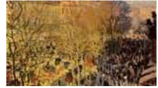
Il Monet della Concordia. Regno Unito e Russia dialogano con gli impressionisti