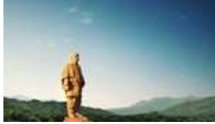
L'India inaugurerà la statua più alta del mondo

Tetzio è mio amico. E se qualcuno deve ucciderlo, quello sono io! Trent'anni di Akira di Domenico Sgambati