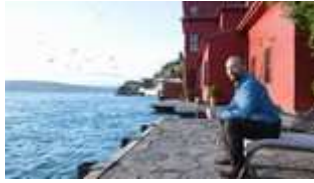
In Turchia, una nave distrugge una residenza storica, set del film di Ferzan Ozpetek