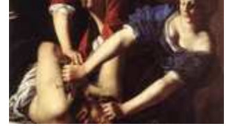
Blood Water Paint. La drammatica vicenda di Artemisia Gentileschi diventa un romanzo