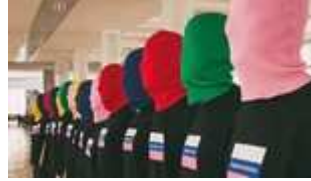
Le Pussy Riot hanno lanciato una linea di abbigliamento